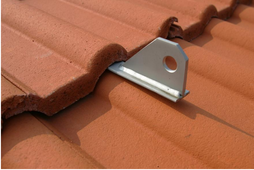
FOTO 1 : ESEMPIO DI ANCORAGGIO / DEVIAZIONE CADUTA TIPO UNI EN795 CLASSE A2