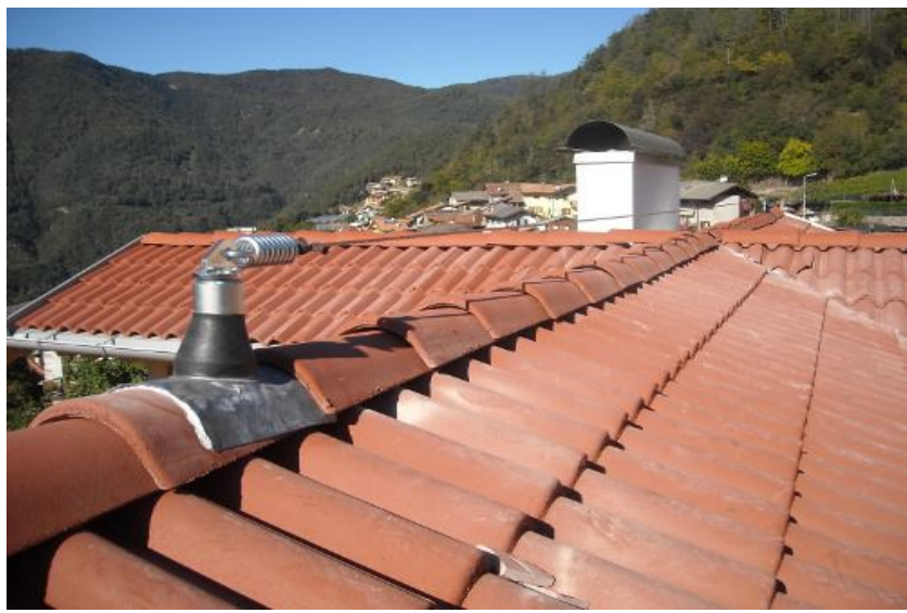
FOTO 2 : ESEMPIO DI SUPPORTO TIPO UNI EN795 CLASSE C, ASSORBITORE DI ENERGIA E FUNE FLESSIBILE